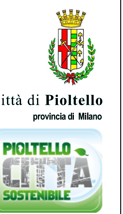
TAVOLA: scala: 1: 5.000